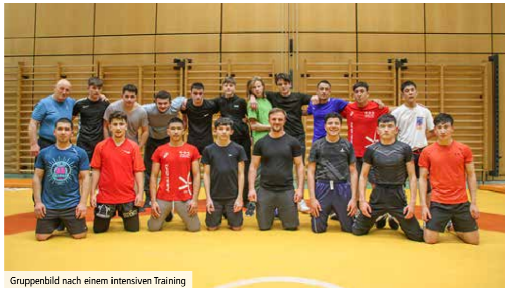
Gruppenbild nach einem intensiven Training

Ein typisches Training läuft so ab, dass zuerst aufgewärmt wird, dann wird meistens ein bisschen Technik geübt, der Hauptteil besteht aber aus dem Ringen. Da sich die Ringer eine Matte teilen,