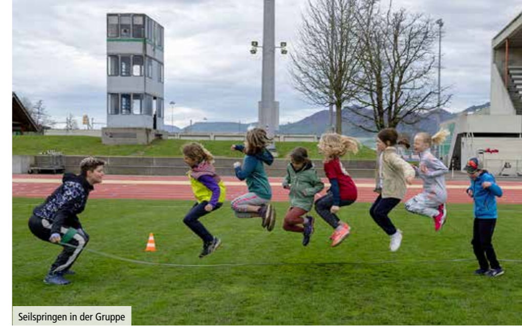
Seilspringen in der Gruppe