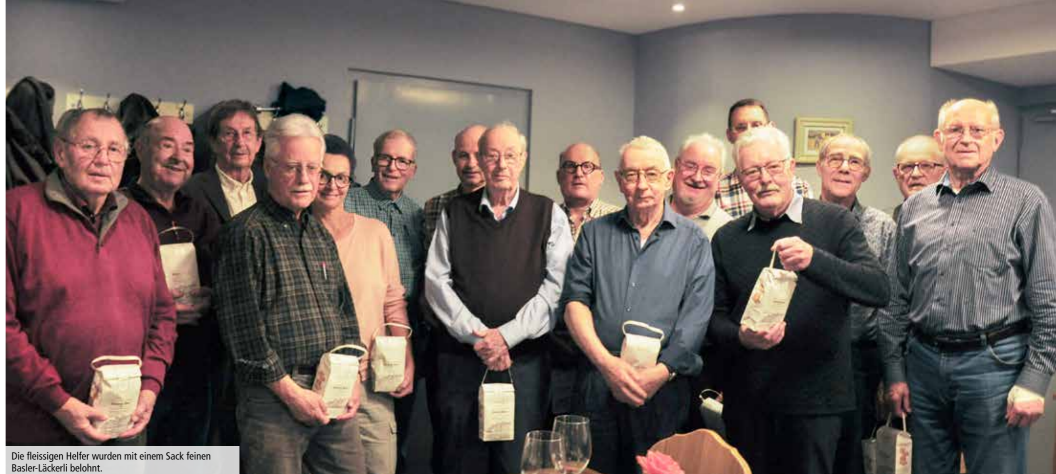
Die fleissigen Helfer wurden mit einem Sack feinen Basler-Lächerli belohnt.

Zum Abschluss überbrachte Beat Nyffenegger die Grüsse des TV Olten Hauptvorstandes und dankte der Männerriege für ihre Arbeit.