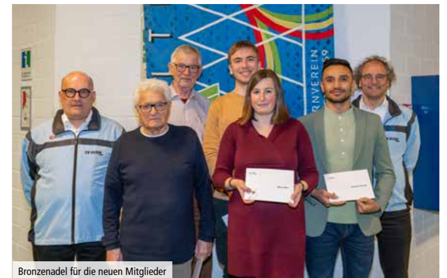
Bronzenadel für die neuen Mitglieder