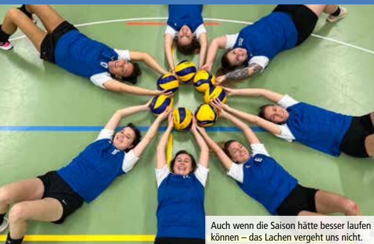
Auch wenn die Saison hätte besser laufen können – das Lachen vergeht uns nicht.

Text: Mirjam Viviani