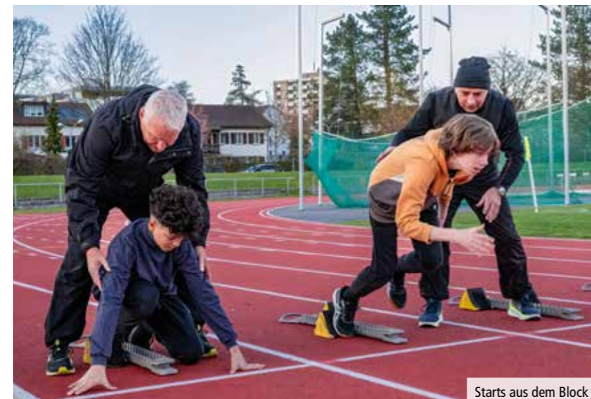
Starts aus dem Block