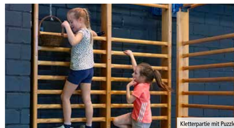
Kletterpartie mit Puzzle

Alle Teams in den drei Alterskategorien kamen dann zusammen zur Rangverkündigung. Die jeweils ersten drei Teams pro Kategorie erhielten Einkaufsgutscheine. Aber auch die vom Migros Kulturprozent unterstützten süssen Trostpreise für alle anderen Teams waren sehr begehrt.