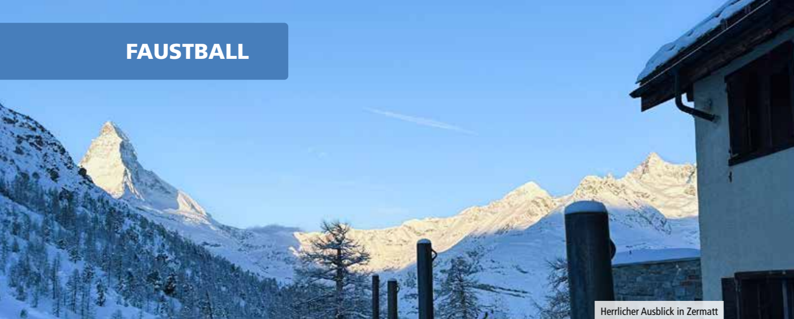
Herrlicher Ausblick in Zermatt