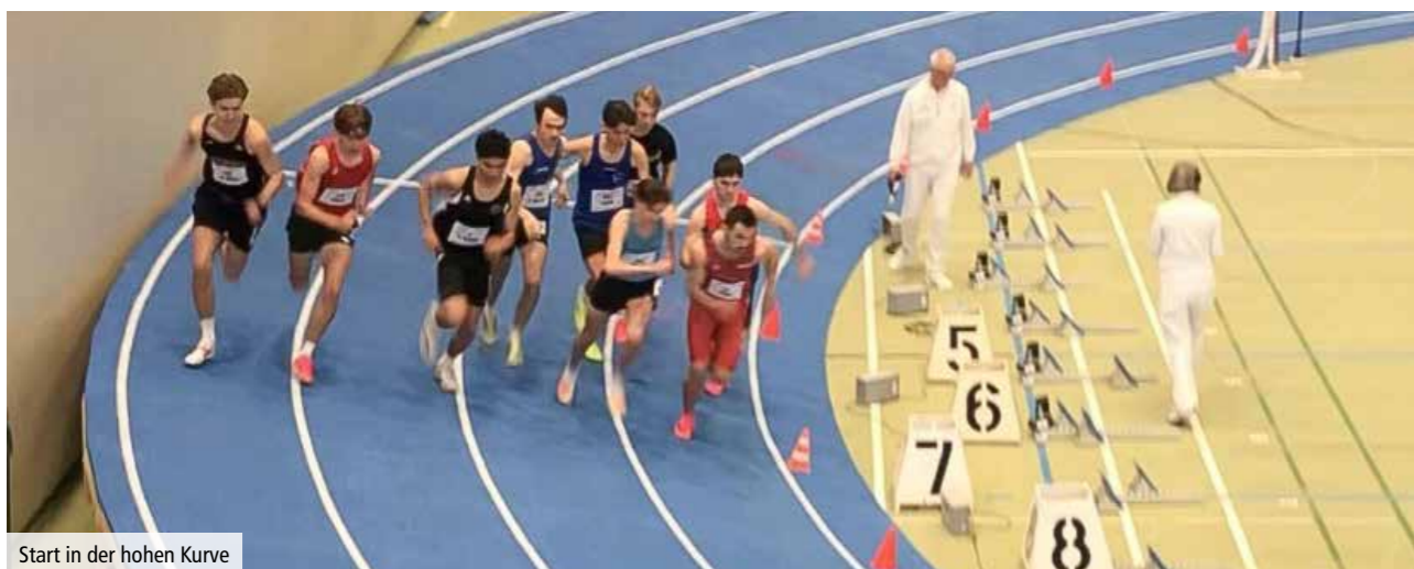
Start in der hohen Kurve

Die Stimmung nach dem zweiten Wettkampftag war aber ausgezeichnet und