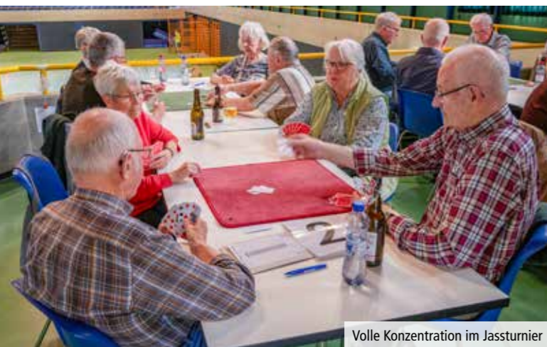
Volle Konzentration im Jassturnier