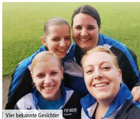
Vier bekannte Gesichter