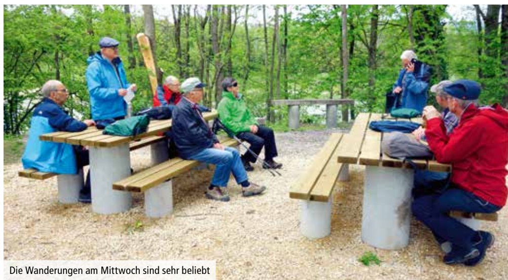
Die Wanderungen am Mittwoch sind sehr beliebt