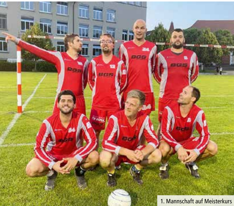
1. Mannschaft auf Meisterkurs

Das Team überzeugte, und wie! Gegen ein aus dem Startspiel ausgepowertes Staffelbach gab es einen schnellen und diskussionslosen 3:0-Sieg. Mit demselben Resultat gewann man das 2. Spiel gegen Oberentfelden 2. Mit diesen 2 Siegen revanchierte sich unser «Eis» für den schwachen Saisonstart und schloss die Lücke zur Tabellenspitze.