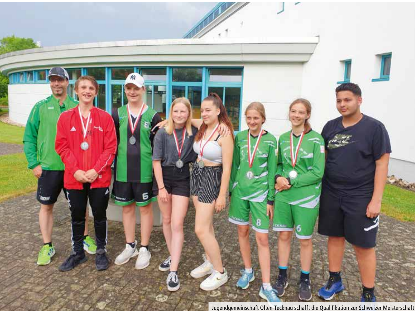
Jugendgemeinschaft Olten-Tecknau schafft die Qualifikation zur Schweizer Meisterschaft

das Fanionteam, warum es das beste Nationalliga B-Team in der Westschweiz ist. In 4 Spielen gaben die Aarestädter nur einen einzigen Spielsatz ab und holten souverän 4 weitere Siege. Das waren die Siege 7-10! Am 10. Juli erhält unser 1 die Gelegenheit, Revanche gegen die Niederlagen aus dem ersten Spieltag zu nehmen. Gegner sind der STV Vordemwald und die FG Fricktal.