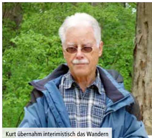
Kurt übernahm interimistisch das Wandern