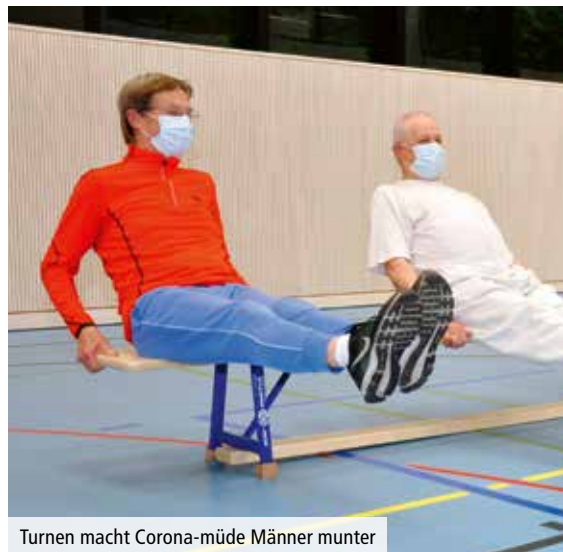
Turnen macht Corona-müde Männermunter