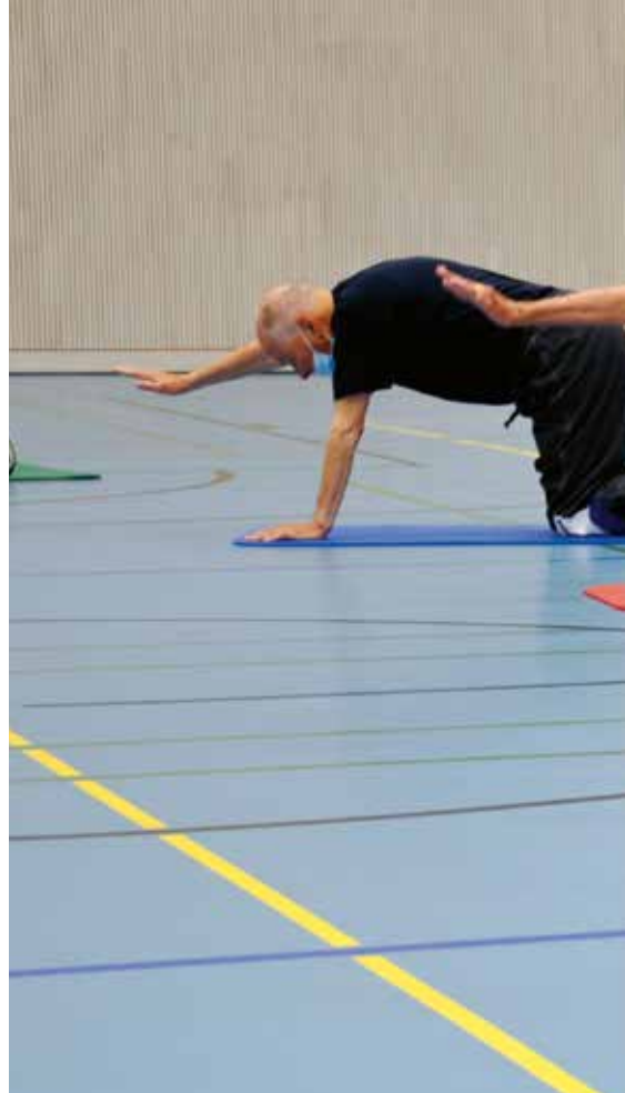
Seit dem 29. April turnen wir wieder in der Kantiturnhalle mit Maske