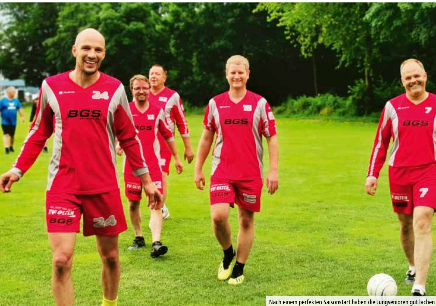
Nach einem perfekten Saisonstart haben die Jungsenioren gut lachen