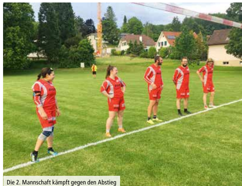
Die 2. Mannschaft kämpft gegen den Abstieg

Gegen Neuendorf unterstrichen die Dreitannenstädter ihre starke Form! Mit 11:5 / 11:6 / 11:4 wurde die erste Partie souverän nach Hause gebracht. Im zweiten Spiel gegen den aktuellen Leader Kirchberg erwartete man eine schwere Aufgabe. Die Berner haben sich in der Breite des Kaders verstärkt und sind ein erfolgshungriges Team. Erwartungsgemäss waren die Spielsätze hart umkämpft. Nach der 1:0-Satzführung durch Oltner (11:9) glichen die Berner aus (7:11). Eine richtungsweisende Wende nahm die Partie im dritten Satz. Beim Stand von 10:10 musste eine 2-Punkte-Differenz erspielt werden, um diesen zu gewinnen. Die Oltner hatten die besseren Nerven und gewannen diesen mit 13:11. Das hatte zur Folge, dass die Oltner im vierten Satz mit viel Selbstvertrauen spielten und die Kirchberger mehr Risiko nehmen mussten. Dies wurde nicht belohnt, die Oltner blieben stabil und brachten die Punkte und auch den Satz mit 11:6 in das Trockene. Mit der besten Teamleistung der Saison wurden weitere wichtige Punkte mitgenommen. An der wegweisenden Doppelrunde in Kirchberg und Tecknau zeigte