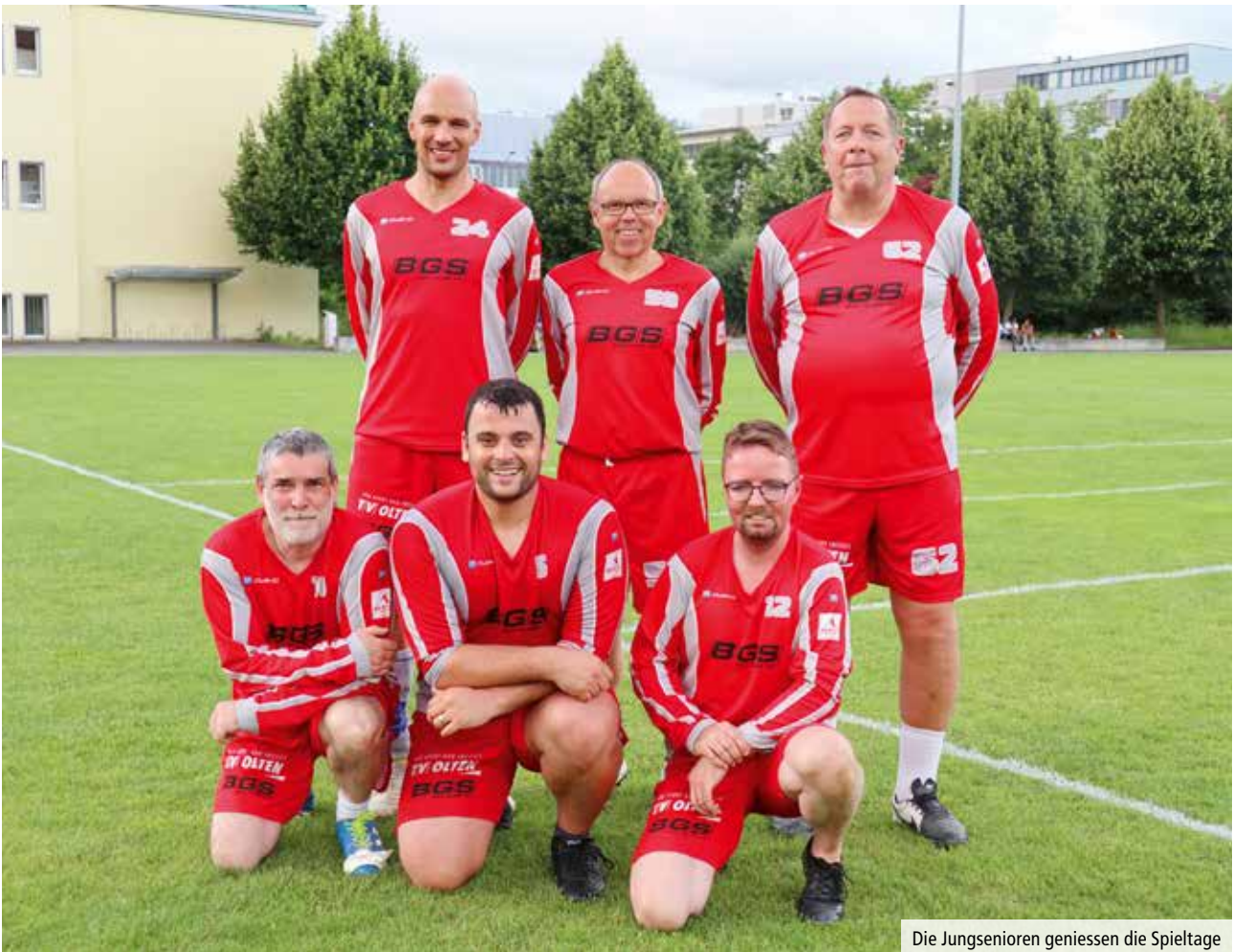
Die Jungsenioren geniessen die Spieltage

gegen die Jungsenioren des Stadtrivalen Satus Olten (26:24) mussten die Aarestädter doch noch die erste Niederlage hinnehmen. Gegen die FG Trimbach-Läufelfingen-Senioren gab es eine 20:29-Niederlage. Mit 3 Siegen aus 4 Spielen ist das Team trotzdem im Soll im Kampf um die Medaillenplätze.