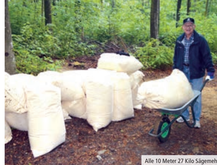
Alle 10 Meter 27 Kilo Sägemehl.