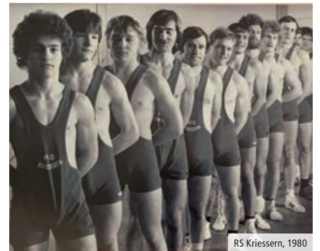
RS Kriessern, 1980

Malen Tapeten Gipsen Decken Parkett Platten Bodenbeläge