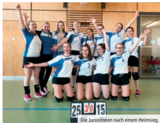
Die Juniorinnen nach einem Heimsieg.

Langsam setzten sich die Volleyballerinnen an den grossen Tisch. Die Stimmung war locker und ausgelassen. Kurze Zeit später wurden die vollen Fonduecaquelons zu Tisch gebracht und wir konnten mit dem Festmahl beginnen.