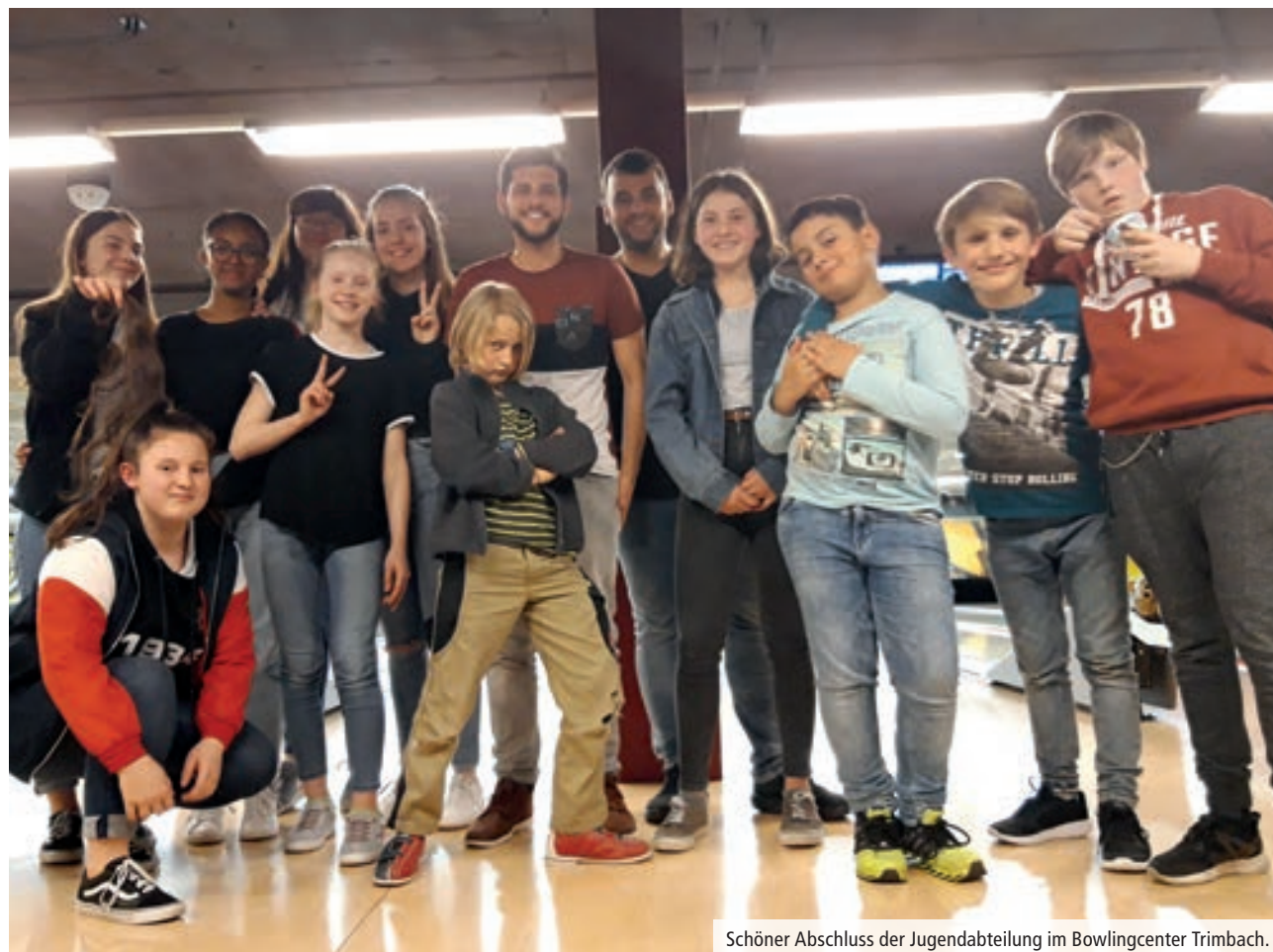
Schöner Abschluss der Jugendabteilung im Bowlingcenter Trimbach.

Text: Marco Campigotto, Foto: Cheyenne Richener