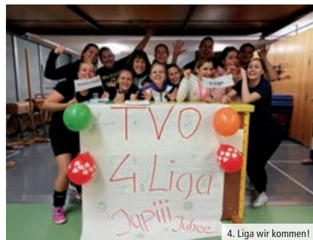
4. Liga wir kommen!