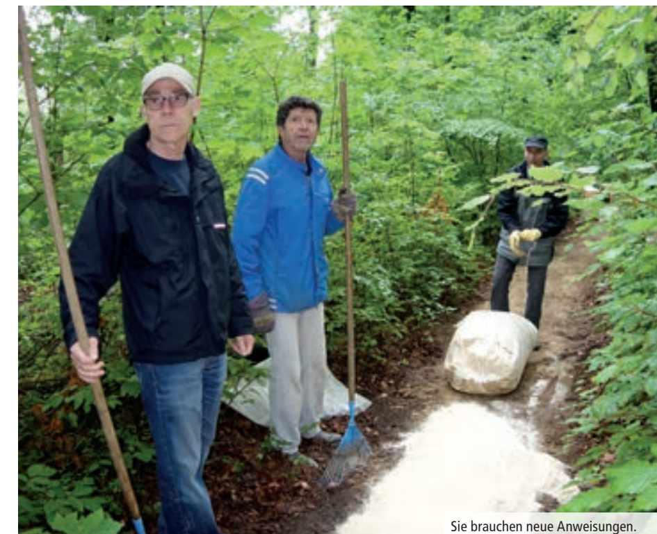
Sie brauchen neue Anweisungen.