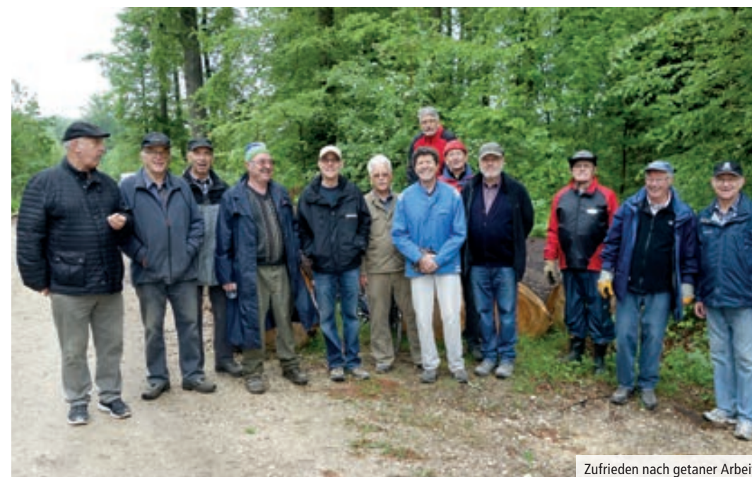
Zufrieden nach getaner Arbeit.