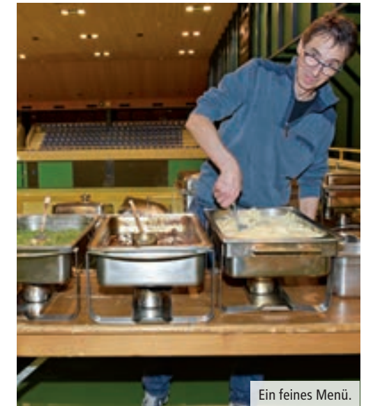
Ein feines Menü.

Zur diesjährigen GV des TV Olten erschienen 110 Mitglieder und Gäste in der Stadthalle im Kleinholz, vom 98-jährigen Ehrenmitglied bis zur 11-jährigen Juniorin.