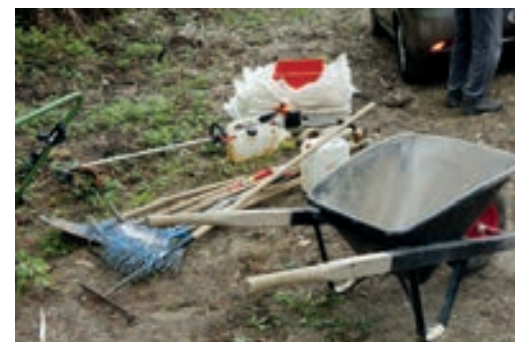
Das Werkzeug stellt der Werkhof zur Verfügung.