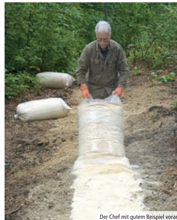
Der Chef mit gutem Beispiel voran.