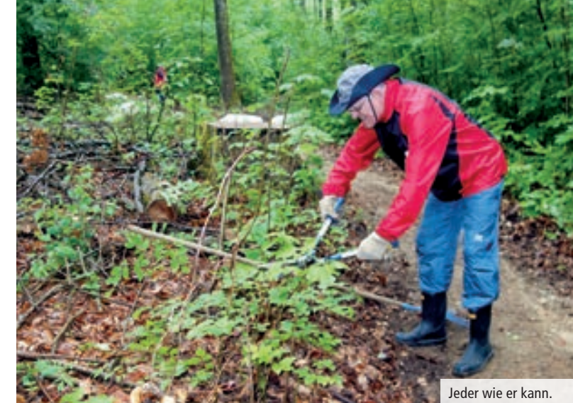
Jeder wie er kann.