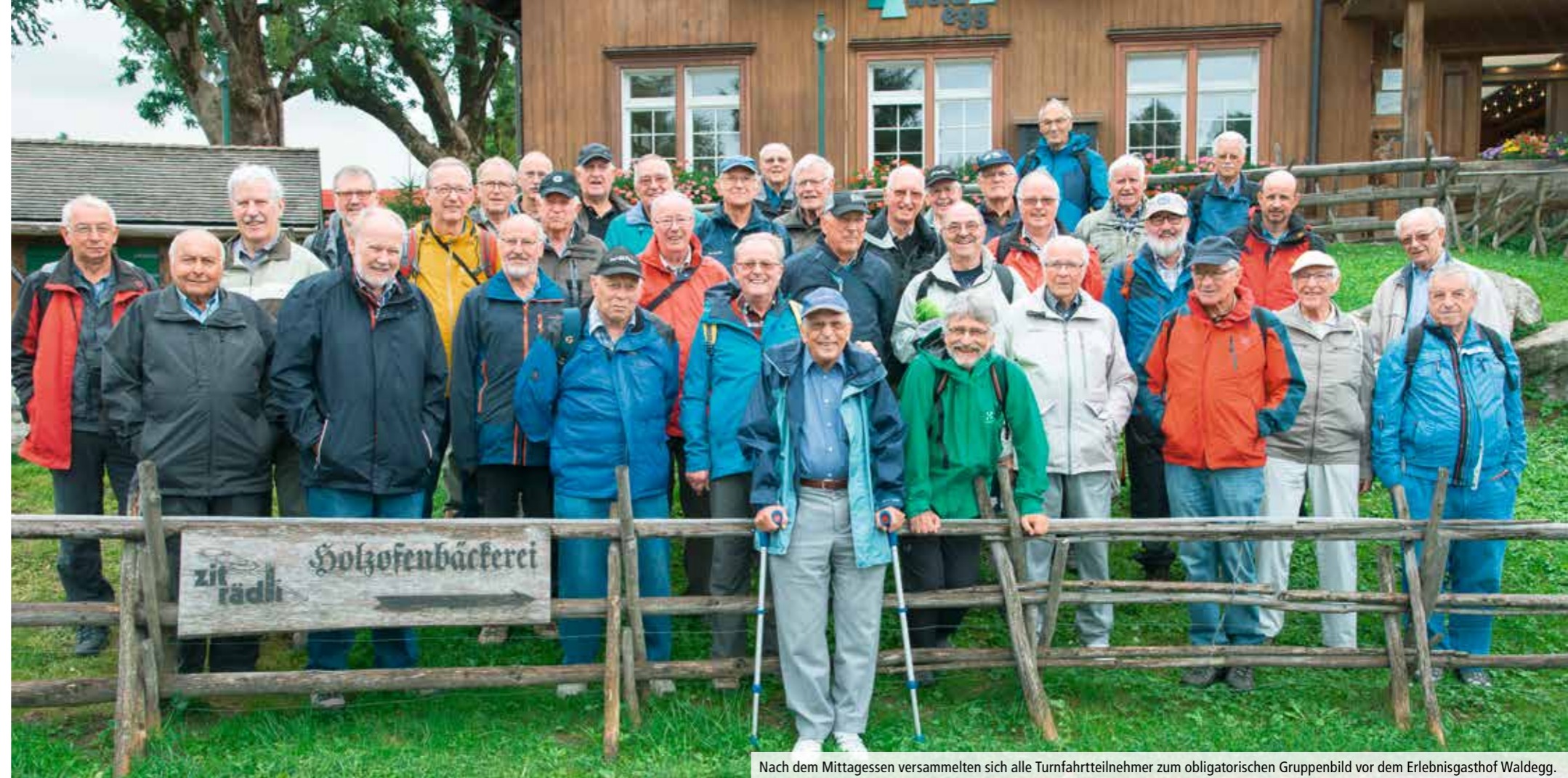
Nach dem Mittagessen versammelten sich alle Turnfahrtsteilnehmer zum obligatorischen Gruppenbild vor dem Erlebnishof Waldegg.

Danach blieb noch genügend Zeit, die verschiedenen Stuben und Museumsräume zu besichtigen. Da ist ein historisches Schulzimmer, ein alter Kaufladen mit vielen originalen Verpackungen vergangener Tage, ein ehemaliger Coiffeursalon, aber auch eine funktionierende Bäckerei und eine Käserei. Eine Attraktion war