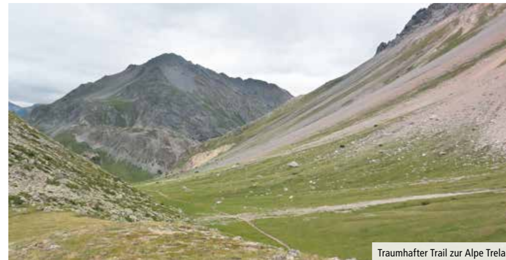
Traumhafter Trail zur Alpe Trela

Nur die Wetterprognosen schienen dem Vorbereitungsprogramm nicht hold. Regen und Höchsttemperaturen von zehn Grad vermeldete die Wetter-App. Tatsächlich zogen während den Übungseinheiten in den ersten Tagen immer wieder Schauer übers Tal und eine spätherbstliche Stimmung machte sich breit. Zum Glück riss die Wolkendecke immer wieder auf, erlaubte wärmende Sonnenstrahlen, die die prächtige Umgebung immer wieder ins beste Licht tauchten, während wir das Umsetzen im steilen Gelände übten oder an der Kurventechnik feilten. Ich fliege durch den Hang, spüre in den Steilwandkurven die