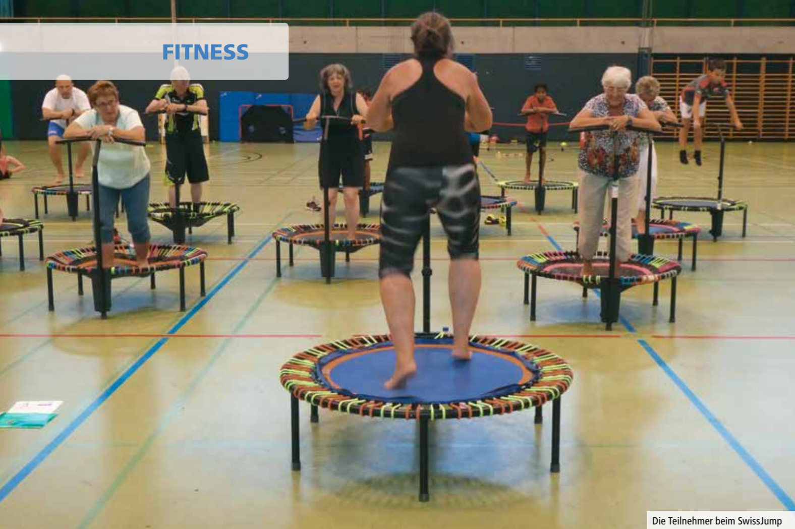
Die Teilnehmer beim SwissJump