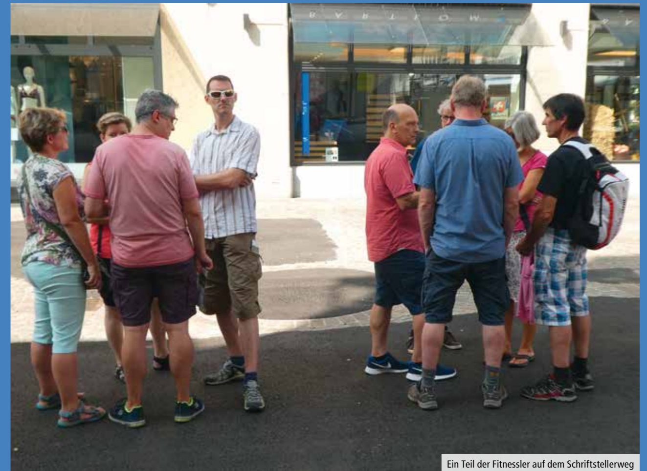
Ein Teil der Fitnessler auf dem Schriftstellerweg