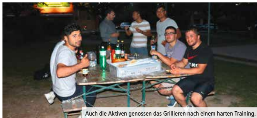
Auch die Aktiven genossen das Grillieren nach einem harten Training.