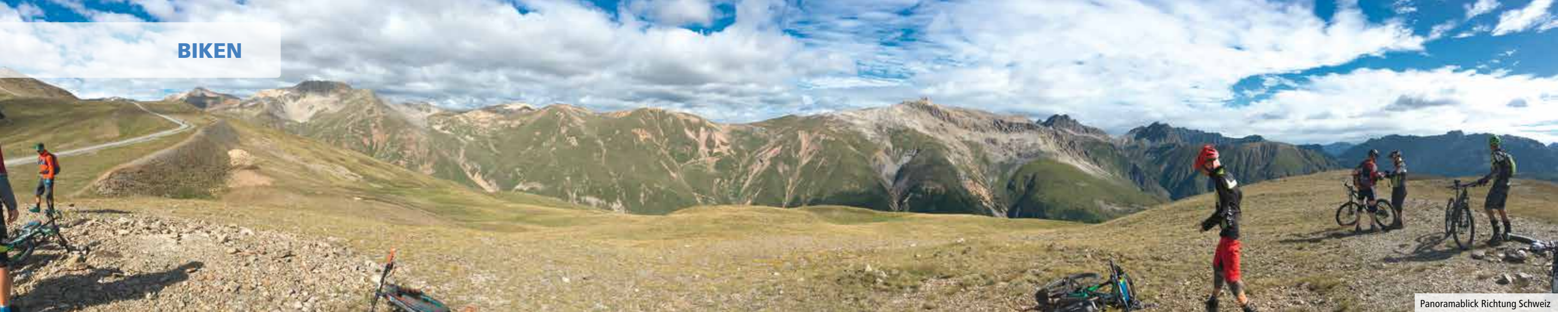
Panoramablick Richtung Schweiz