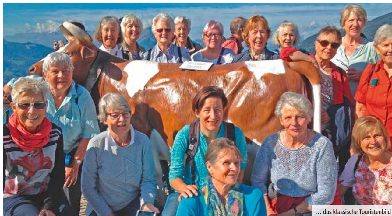
... das klassische Touristenbild