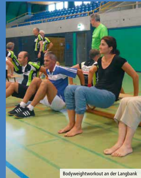
Bodyweightworkout an der Langbank

wegten sich über 50 Frauen und Männer jeglichen Alters im Rhythmus der Musik. Einige von uns verzichteten auf das Turngerät, damit die ESV-Mitglieder dieses ausprobieren und mitmachen konnten. Alle 15 Minuten wechselten die Teilnehmer den Posten, sodass am Ende jeder jeden Posten absolviert hatte. Trotz Anstrengung und Schweiß während und Durst nach unserem Programm, erhielten wir viel Lob und die Teilnehmer hatten viel Spass. Einige waren auch von der Intensität unserer Trainings überrascht. Unser Beitrag brachte nochmals viel Bewegung in den Anlass und lieferte Gesprächsstoff beim anschliessenden gemütlichen Beisammensein. Am späteren Nachmittag ging der Jubiläumsanlass dann zu Ende. Fitness und Spiele ist nun bei vielen Mitgliedern des ESVO bekannt und bleibt, weil sie sich mit uns bewegten, in Erinnerung.