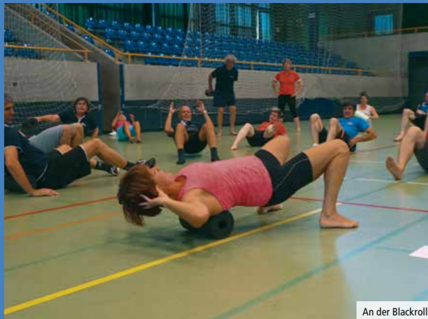
An der Blackroll

Am Morgen wurden verschiedene Aktivitäten angeboten, bei welchen das Ziel die Stadthalle Kleinholz war. Wir entschlossen uns, gemeinsam das Angebot des Schriftstellerweges zu nutzen. Treffpunkt war beim Aperto Shop auf dem Perron des Bahnhofs Olten. Von dort ging es gemütlich zu Fuss via Bahnhofbrücke, Amthausquai, Zielem, Hauptgasse, Oberer Graben, Schützenmatte ins Kleinholz zur Stadthalle. Unterwegs an den verschiedenen Punkten des Schriftstellerweges musste mittels des Smartphones der QR-Code gescannt werden, damit eine Geschichte eines Schriftstellers gehört werden konnte. Rund ein Dutzend Personen standen jeweils aufgeteilt in kleine Gruppen um ein Smartphone und lauschten gespannt den Geschichten