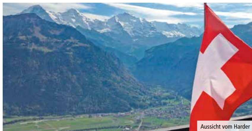
Aussicht vom Harder

Die 18 Turnerinnen, welche an der diesjährigen Seniorinnenreise teilnahmen, wissen, was damit gemeint ist. Angekommen in Interlaken, durfte der Startkaffee natürlich nicht fehlen und danach ging es bei schönstem Herbstwetter gemütlich Richtung Harderbahn. Oben angekommen, erwartete uns eine fantastische Aussicht auf der vor ein paar Jahren erstellten Plattform. Nach vielen «Ahs» und «Ohs» und den obligatorischen Fotos war es schon Zeit für einen Apéro. Vom sehr freundlichen Personal wurden