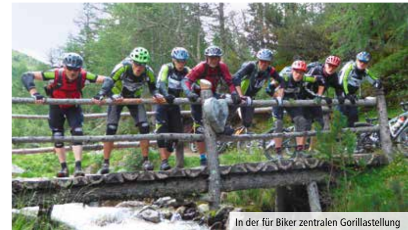
In der für Biker zentralen Gorillastellung