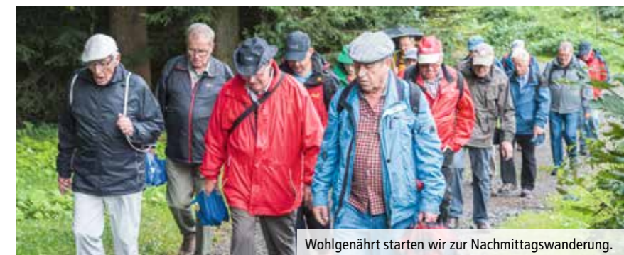
Wohlgenährt starten wir zur Nachmittagswanderung.