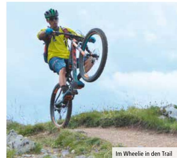
Im Wheelie in den Trail